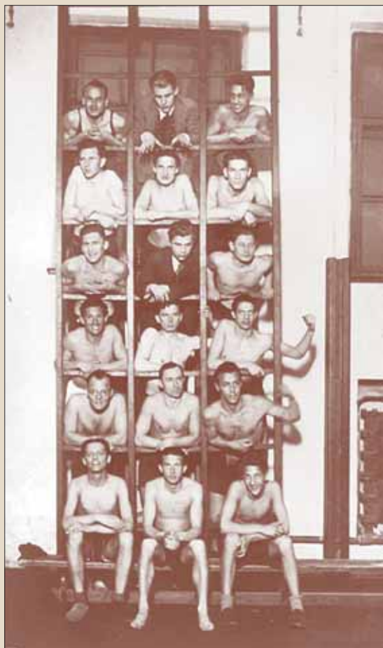
Na satu tjelesnog odgoja u zadarskoj gimnaziji 1932. godine

U razdoblju između 1918. i 1941. godine u osnovnim su školama nastavu tjelesnog odgoja predavali učitelji redovne nastave